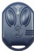
mod: JUBY SMALL