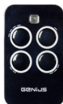
mod: ECHO TX 4