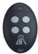
mod: MITTO 2M mod: MITTO 4M