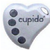
mod: CUPIDO 2 mod: CUPIDO 4