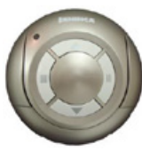
mod: APPLE 2 mod: APPLE 4